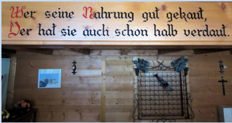
Qui mâche bien sa nourriture, l'a déjà digérés à moitié