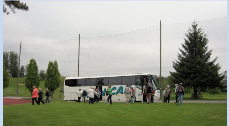
Pause café-croissant en Gruyère