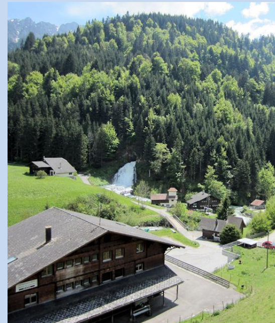
L'ancienne église de Jaun