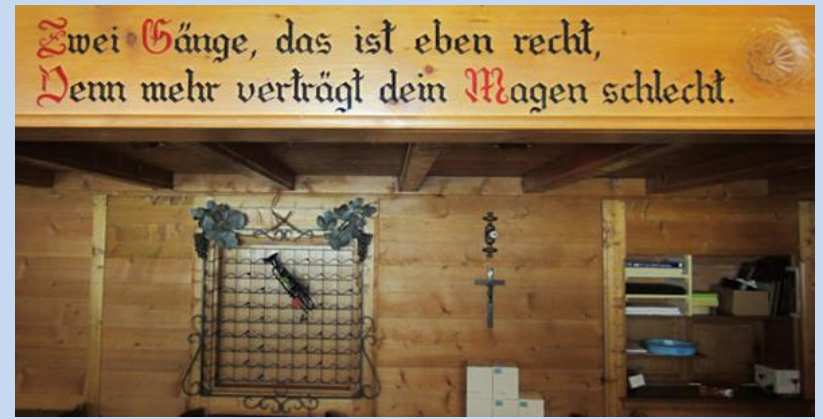
Deux plats c'est bien, plus, c'est trop pour ton estomac