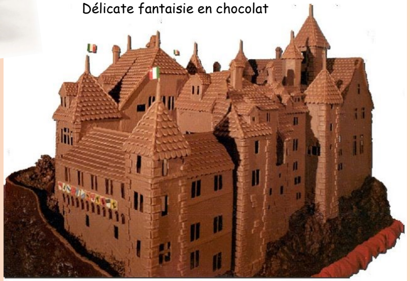
Délicate fantaisie en chocolat