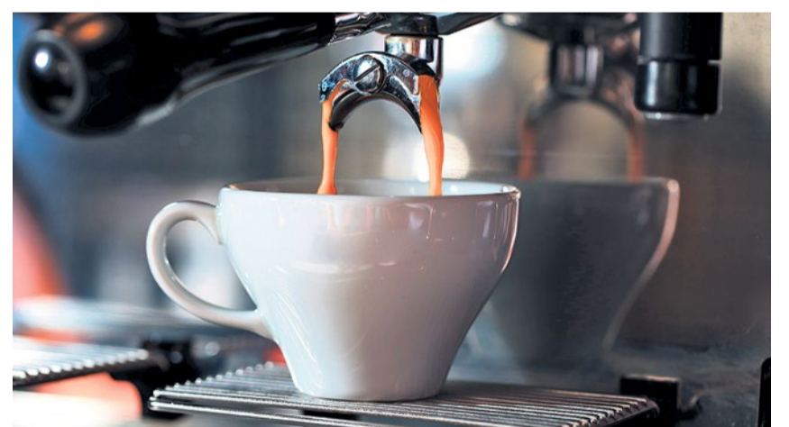
Der Muttertags-Gottesdienst dreht sich ums Thema «Kaffee».