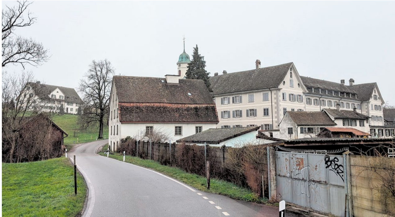
Auf dem Weg ins Konflager besuchten die Konfirmand:innen auch das Benediktinerinnen-Kloster Fahr.

Kennen Sie die Geschichte von Zachäus? Genau, jener Geldeintreiber aus dem Neuen Testament, der,