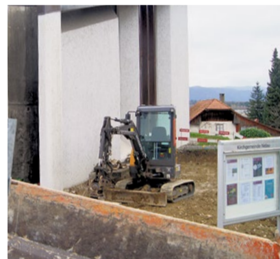
Erste Impressionen des Umbaustarts.