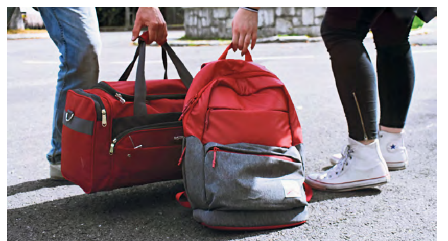
Geflüchtete Menschen stehen hier vor Herausforderungen.