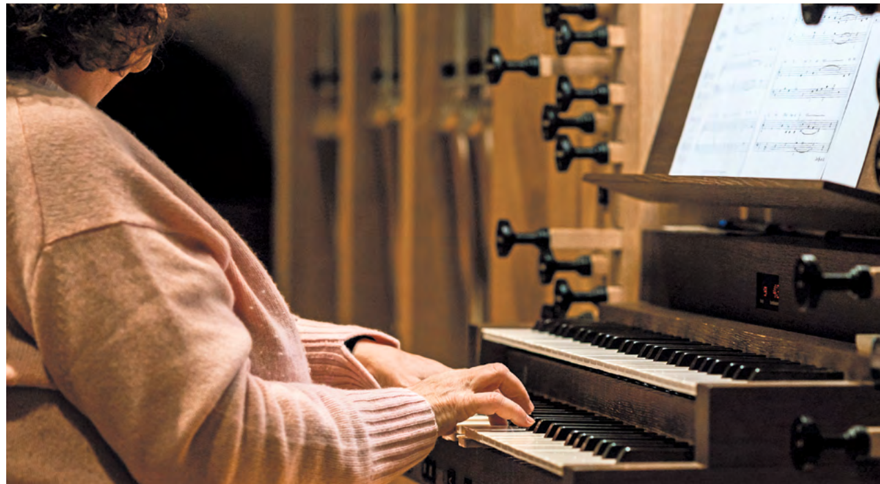
Die Orgel der Kirche Nidau wird in die Marktkonzerte stets integriert.

Diesen Sommer werden Orgel und Markt nicht direkt benachbart sein wie üblich, da in der Mittelstrasse