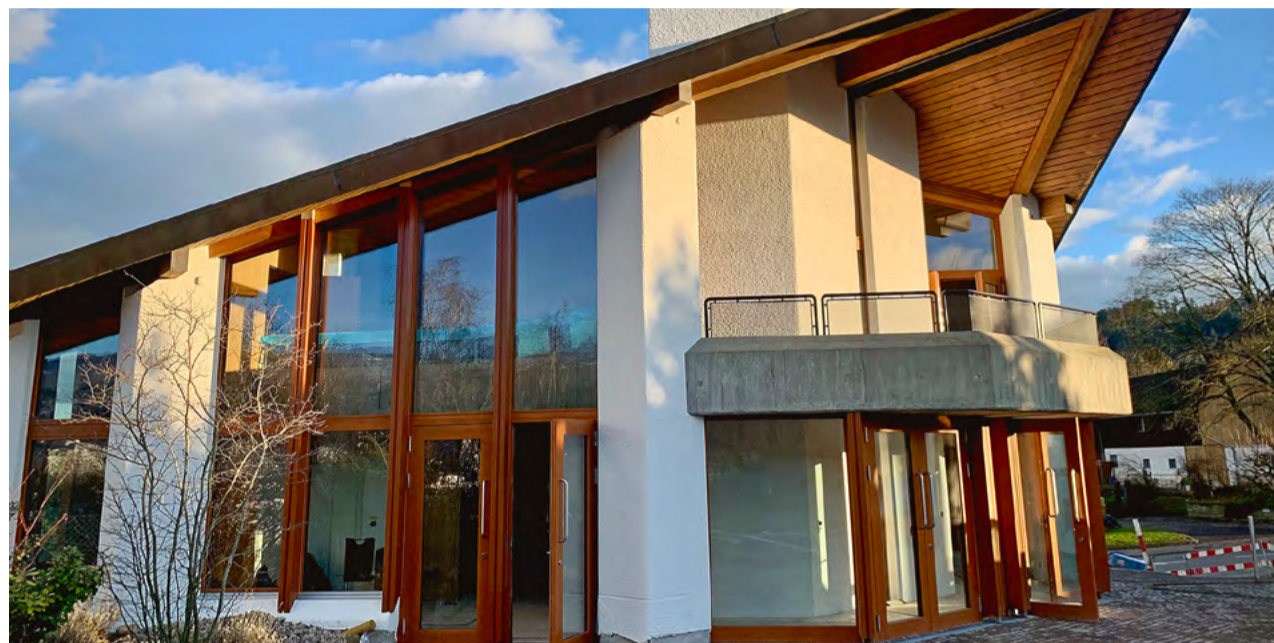
Wir öffnen die Türen des fertig umgebauten Matthäus-Zentrums am 22./23. März.

Was wurde nun seit dem Baustart vom 11.3.2024 unter anderem neu? – Im Erdgeschoss gibt es einen grossen Saal mit einer neuen Bühne und zwei abtrennbaren Neben-